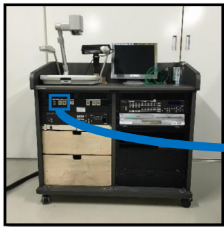
(大ホール専用 映像ラック)

当ホールの映像ラックでは、パソコン映像の入力端子はVGA (D-sub) になっています。