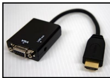
HDMI → VGA

※ なお、変換アダプターを使用した場合、画質が悪くなったり、色がきれいに再生できなかったり、最悪の場合、投影できないというトラブルが起きる可能性があります。