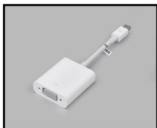
マック専用 mini displayport → VGA