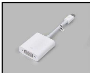
マック専用 mini displayport → VGA