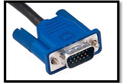
このようなコードで パソコンと接続します。