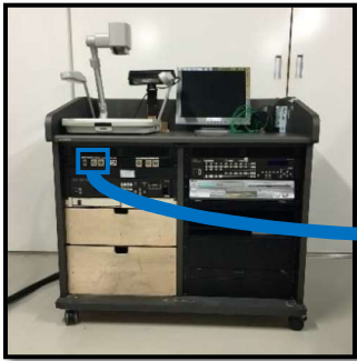
(大ホール専用 映像ラック)

当ホールの映像ラックでは、パソコン映像の入力端子はVGA (mini D-sub) になっています。