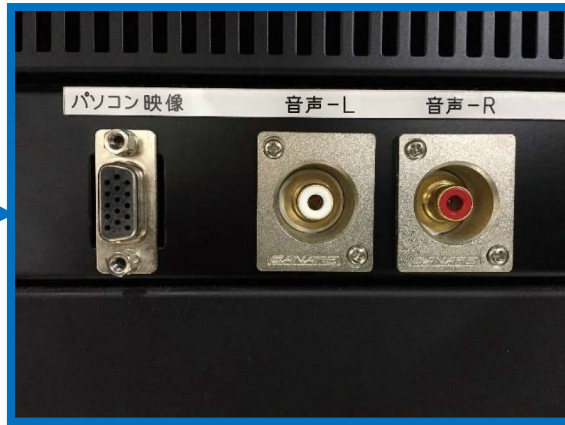
(入力コネクター部分 拡大写真)