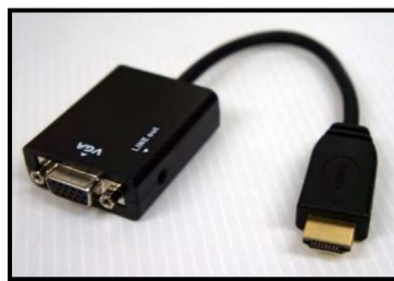
HDMI → VGA

※ なお、変換アダプターを使用した場合、画質が悪くなったり、色がきれいに再生できなかったり、最悪の場合、投影できないというトラブルが起きる可能性があります。 催物当日の早めのチェックか、事前のチェックをおすすめします。