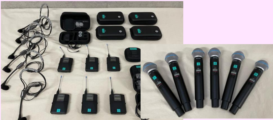
大ホール・小ホール・市民交流室のワイヤレスマイクが新しくなりました