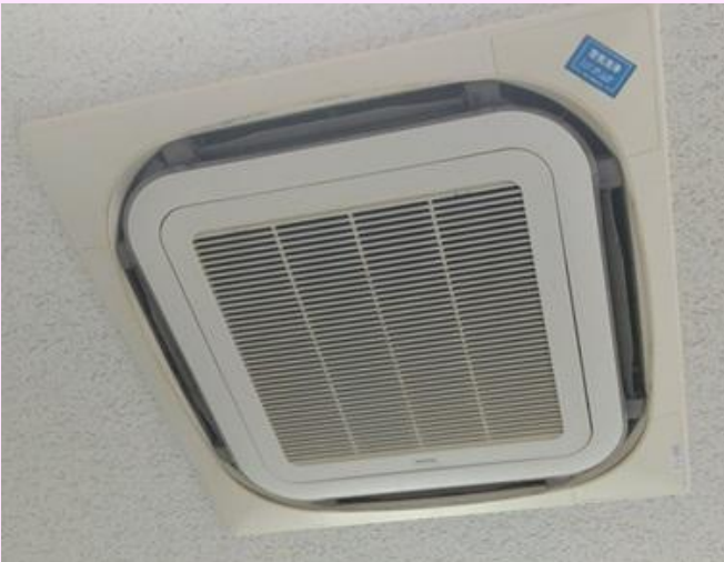
各所の空調を修繕し快適になりました