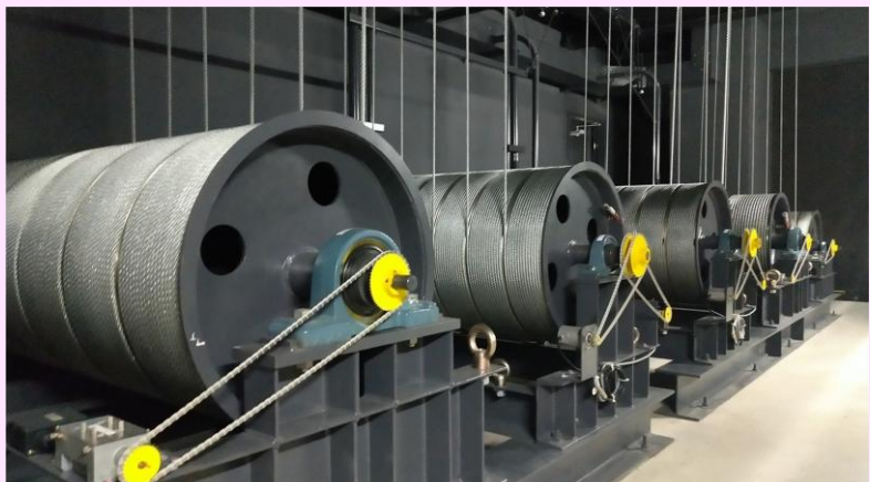
大ホールの舞台機構(インバーター)を更新