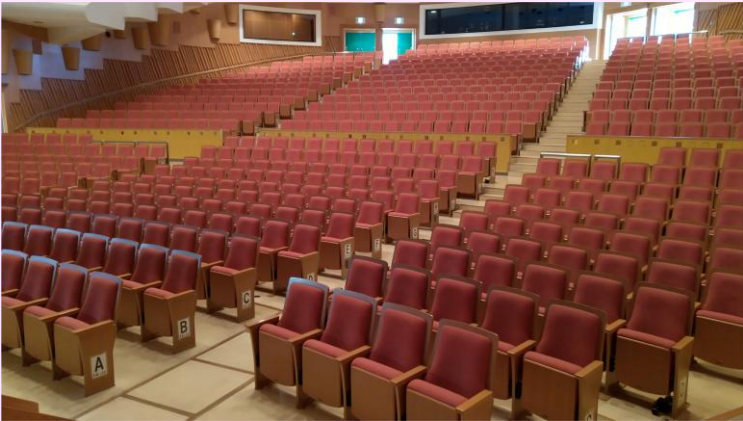
ホールの空調環境が快適になりました