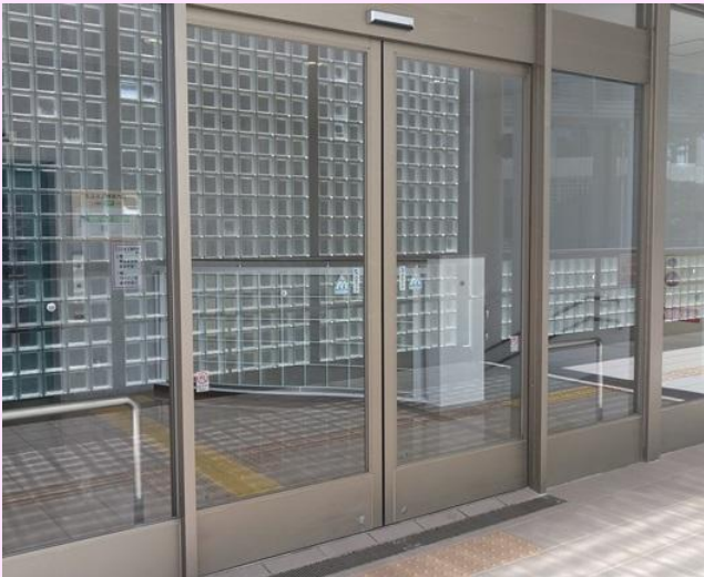
各所の自動ドアを修繕しました